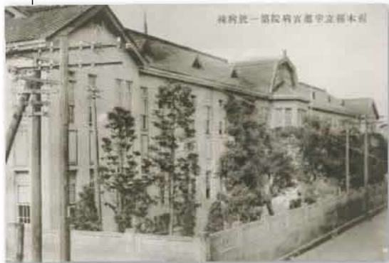
洋風の宇都宮病院第1号病棟全景

一袋の絵葉書が残されている。表には「増改築記念繪はがき 栃木縣立宇都宮病院」の文字。裏側には診療科目に加えて病床数や入院料などが記され、所在地は旭町二丁目とあった。その場所は、現東武宇都宮駅の東側、総合福祉センター一帯。明治時代に作られた鳥瞰図「宇都宮市真景図」には、江野町の表示下に、今は無きその本館や病棟群が詳細に描かれ往時の様子がうかがえる。また、前述した入院料の記述も興味深い。「特等二床副室一、四、五〇〇」「三等二一四床合室一、〇〇〇」と並んで、伝染病室入院料の文言が目を引く。一等二床一室で一人三〇銭だった。増改築が行われた一九〇三明治三十六年