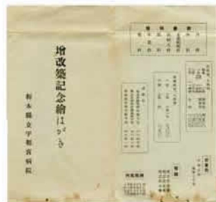
絵葉書に入った袋

一袋の絵葉書が残されている。表には「増改築記念繪はがき 栃木縣立宇都宮病院」の文字。裏側には診療科目に加えて病床数や入院料などが記され、所在地は旭町二丁目とあった。その場所は、現東武宇都宮駅の東側、総合福祉センター一帯。明治時代に作られた鳥瞰図「宇都宮市真景図」には、江野町の表示下に、今は無きその本館や病棟群が詳細に描かれ往時の様子がうかがえる。また、前述した入院料の記述も興味深い。「特等二床副室一、四、五〇〇」「三等二一四床合室一、〇〇〇」と並んで、伝染病室入院料の文言が目を引く。一等二床一室で一人三〇銭だった。増改築が行われた一九〇三明治三十六年