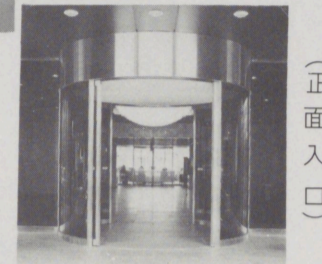
▲ 円型自動ドア (正面入口)