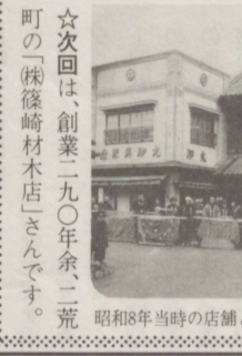
昭和8年当時の店舗と、出展する花嫁荷物