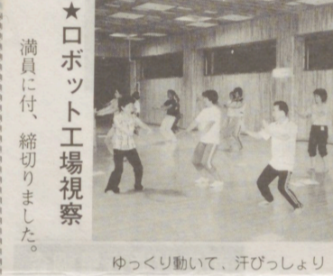
ゆっくり動いて、汗びっしょり

楽しく覚えて、効果満点！ 日時 9月19日(土) 19時~21時 場所 市体育館(駅東口) ほか 10・11月は県体育館・無料