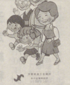
県下一斉のポスター

ふれあう心で おつき合。 ち直しの形が出てきたが、官公需部門の受注競争激化で、環境は依然厳しい。 売上は、55年度第4四半期の落ち込みから、ようやく上昇基調に転じ、価格も受注単価の上昇伸び率が著しい。原料価格も、40%の企業が「上昇」としている。収益は前期も振わず、前期より幾分か好転したに留まった。悪化要因としては、「人件費の上昇」や、「売上数量の減少」があげられ、企業収益を圧迫している。 金融をみると、借入状況は幾分か和らいだが、資金繰りは依然厳しい状況下にある。需要停滞による売上・受注の不振が影響している。設備投資は、「生産能力の拡大」や「新製品開発」の順で、25%の企業が「行っていない」。次期については、収益の好転を予測している。