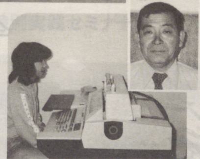
▲斎藤塗料(株)オフィス

販売管理業務を中心として、オフィスコンピュータを利用しています。得意先売掛残高表では、業種別・得意先別に分類集計され、業種別の売上分析も一表で利用できるように工夫されています。