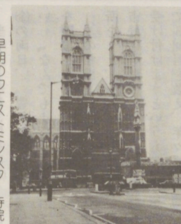
早朝のウエスタ(エントランス)と寺院

(会員購読料は会費の中に含まれています) 発行所 宇都宮商工会議所 宇都宮市中央3-1-4 〒320 ☎ 37-3131 編集者 橋本邦男 発行人 橋本邦男 印刷所 ショウワ印刷機 宇都宮市の人口 395,887人 当会議所会員数 5,847人