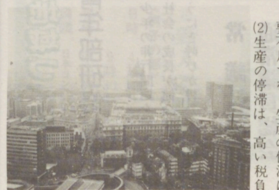
ロンドン サ・シティ俯瞰 (中央はセントポール大寺院)

七〇年代の英国経済は物価・賃金の上昇率が高く、成長率・労働生産性が低い状況が続いていて、いわゆる英国病と言われる状態を呈していたが、七九年五月に権に就いたサッチャー首相が示した「英国病」に対する診断と政策は、次のようなものであった。 (1) 英国経済の低迷の原因は、需要不足ではなく生産の停滞にある。(2) 生産の停滞は、高い負担に