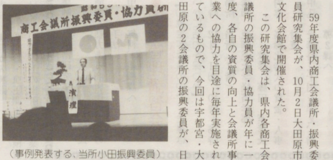
(事例発表する、当所小田振興委員)

59年度県内商工会議所、振興委員研究会が、10月2日大田原市文化会館で開催された。