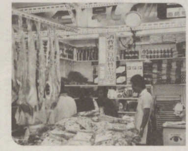
5月30日は、「消費者の日」で、昭和43年のこの日に、消費者の日の制定が行われた。消費者の日の制定は、消費者の権利の保護と、消費者の利益の増進を目的として、5月30日(日)を「消費者の日」として制定された。この日は、消費者の権利の保護と、消費者の利益の増進を目的として、5月30日(日)を「消費者の日」として制定された。

当所が実施した59年度第4四半期(1月13日)市内中小企業景況調査が、3月調査より調査によると、景況は全業種とも消費者の購買意欲低下などから需要の伸び悩みが続き、低調な足取りに推移し、総じて不況であった。前期まで4期連続プラス基調を維持してきた製造業は、受注の減少などにより売上が悪化、同様に前期好調に推移したサービス業も需要の減少などを理由に大市に低下した。また卸売業も、需要の減少などにより売上が悪化、同様に前期好調に推移したサービス業も需要の減少などを理由に大市に低下した。また卸売業も、需要の減少などにより売上が悪化、同様に前期好調に推移したサービス業も需要の減少などを理由に大市に低下した。