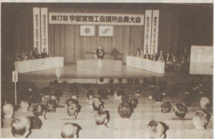
第17回会員大会 (10月25日栃木会館小ホール)