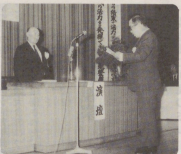
優良従業員表彰受賞者代表挨拶 栗野交通第二回整一さん