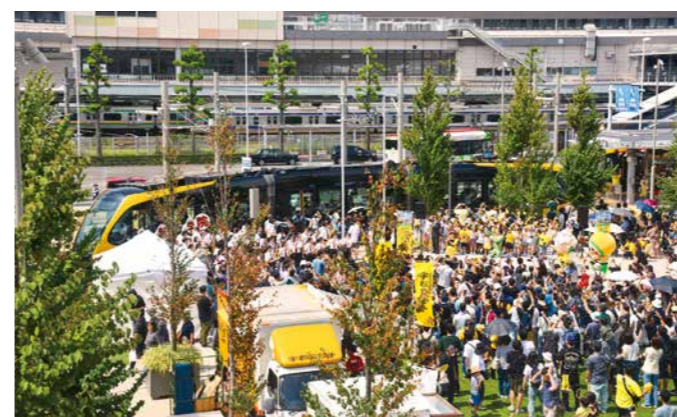
8月に開催された、ライトライン開業1周年記念イベント(8月25日)