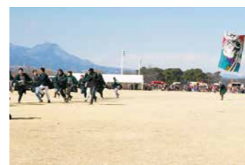
過去の凧揚げ大会の様子

前橋商工会議所青年部「緑水会」では、日本の伝統の遊びである「凧揚げ」を通じて、家族や友達とのコミュニケーションの場を作り、伝統的な遊びを次世代に継承していきま。今年度は、恒例の大凧揚げやスタントカイトに加え、新たにジャンボカイト揚げや新潟県三条市の三条凧による上州けんか凧を開催いたします。またキッ