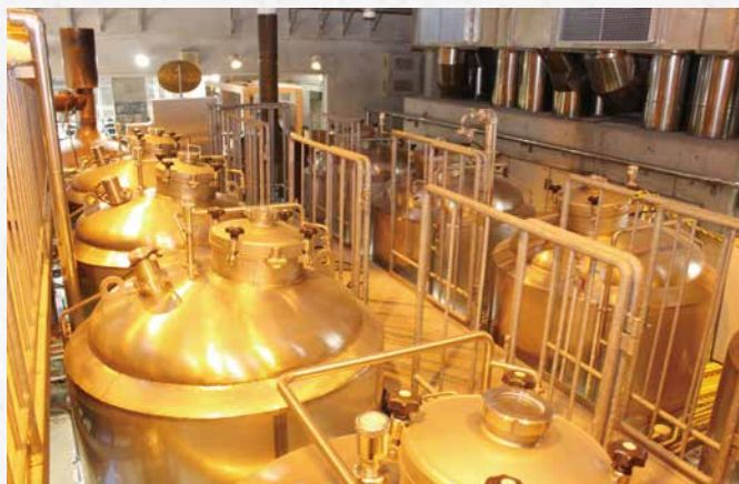
年間を通じてさまざまなビールを醸造

地ビールは、地域の特色を出す商品の一つとして全国各地でつくられています。その中で、ろまんちっく村ブルワリーは2年後の令和9年に30周年を迎えます。お酒の楽しみ方もクラフトビールのように多様性に満ちている現代。あえて地域の特産を使った「地ビール」にこだわるろまんちっく村ブルワリーは、これからも地域の魅力を発信していくことでしょう。