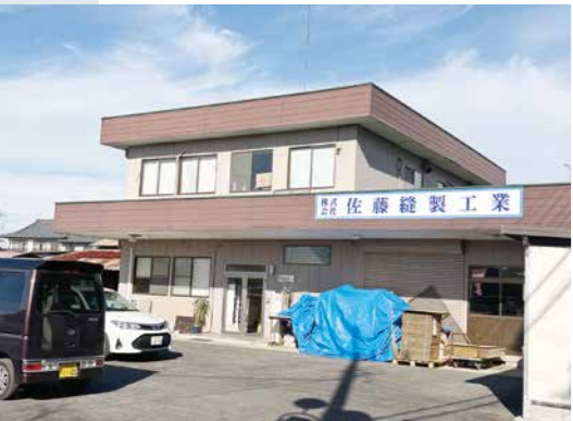
譲渡企業：(株)佐藤縫製工業