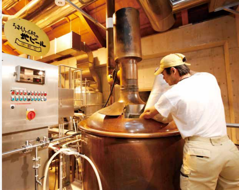
ろまんちっく村ブルワリーの醸造所

平成26年1月1日から施行された「とちぎの地元の酒で乾杯を推進する条例」は、栃木県産のお酒で乾杯することを推進する、地産地消の促進や郷土を誇り愛する社会機運醸成を目的とする条例です。施行後10年を記念して地元のお酒メーカーをご紹介します。第4回は人気の「地ビール」を生産する道の駅うつのみやろまんちっく村ブルワリーです。