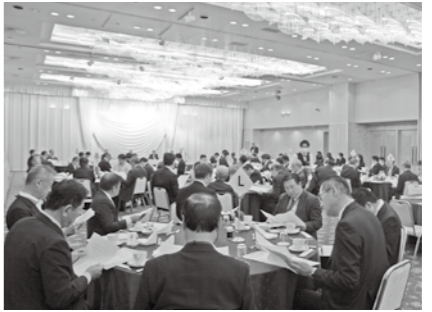
会議では会員等の加入が承認

当所では、令和6年12月23日(月)に、第4回常議員会ならびに臨時議員総会を開催しました。会議では、会員および特別会員の加入が承認され、その後の報告事項では、第49期宇都宮商工会議所議員選挙選任等の事務日程および意向調査等の実施などが報告されました。第48期の議員任期が令和7