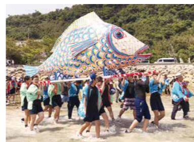
平安座島の伝統行事「浜下り」とマリンスポーツが楽しめる「伊計ビーチ」

宇都宮市が初めて国内の都市と 友好都市提携を結んだ 沖縄県うるま市の魅力をお伝えします。