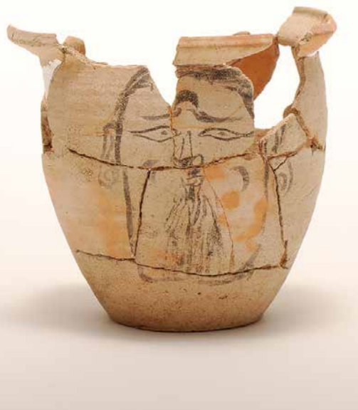
秋田城跡で出土した人面墨書土器。病氣や悪いことをおこすと考えられる「ケガレ」を払う儀式に使われた。

古代において、律令制度が整備されると都の置かれた近畿地方だけでなく、国ごとに医師(国医師)が一人配置され、地方でも医師の教育・指導が行われました。