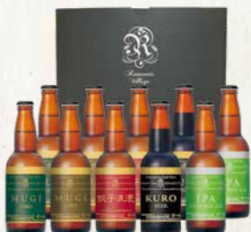
麦太郎、麦次郎など人気銘柄10本セット

原料のホップを麦太郎の約10倍量使用し、柑橘やトロピカルフルーツのような華やかな香りとしつかりとした苦みが特徴のアメリカンスタイルビールです。