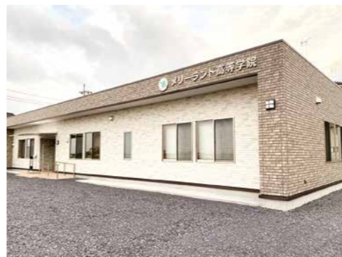
譲受企業：(株) MerryLand ホールディングス

飲食業等で後継者不在の事業所の事業承継を企図し、手続きの進め方や留意点についてアドバイスを求め、当センターに相談となりました。