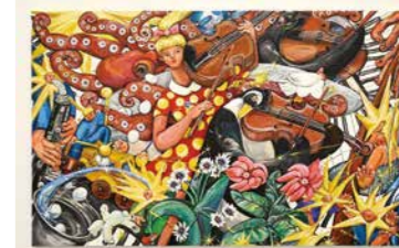
近藤亜樹(ザオーケストラ) 2024年(部分)