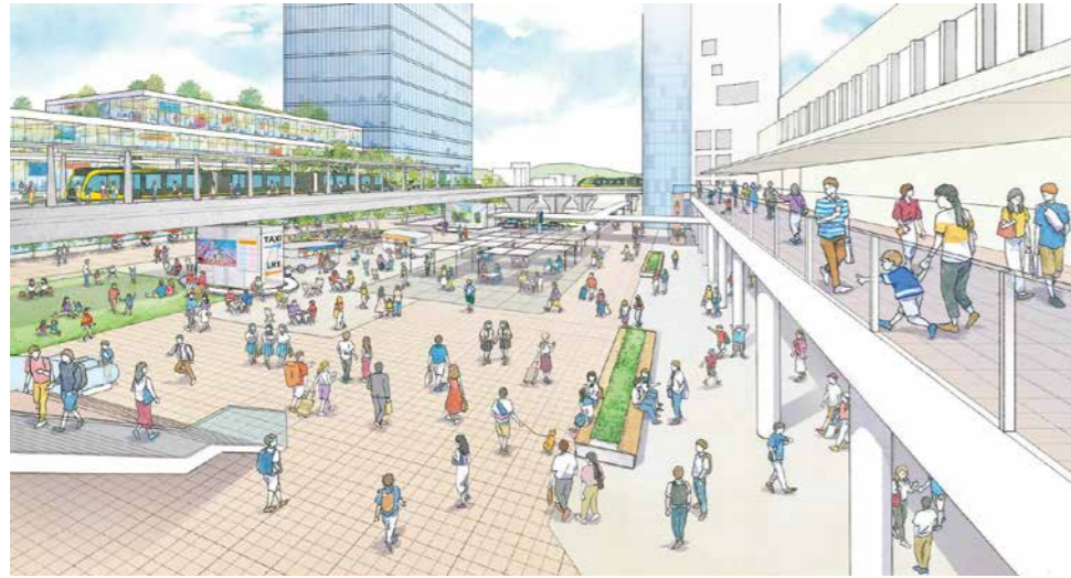
JR宇都宮駅西口周辺地区の将来イメージ(宇都宮市提供) ※LRTの構造や駅前広場、周辺開発、交通動線などについて確定したものではありません

駅西口周辺地区においては、将来イメージ図にあるような、多くの人々が行き交う人中心の空間や、賑わいと緑にあふれる空間にしていくことで、全国に誇れる宇都宮の顔として魅力と活力あふれる空間を創出したいと