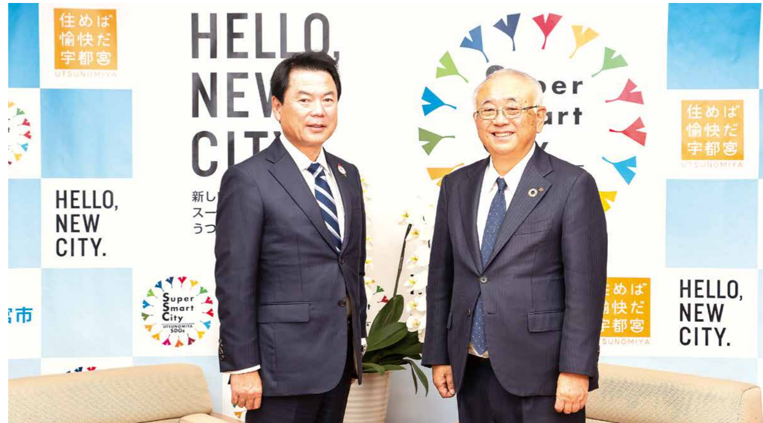
能登半島地震から始まった令和6年。不安な年の始まりでしたが、ライトライン開業一周年やうるま市との友好都市提携など明るい話題も多かった昨年を振り返り、新たな一年の決意をお聞きました。