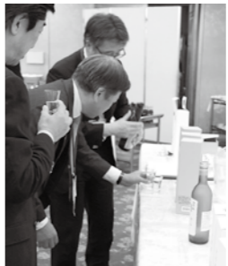
忘年会で設けた宇都宮の地酒コーナー

年10月31日までとなっているため、令和7年度には1号議員選挙、各部会による2号議員の選任、3号議員の選任会議等が順次開催されることとなります。会議の閉会後には、議員懇話会との共催による忘年会が開催され、恒例の『お楽しみ抽選会』が盛大に行われました。また、会場には宇都宮の地酒コーナーや(協)宇都宮餃子会による焼餃子コーナーなどが設けられ、議員同士が、郷土の味に舌づつみを打ちながら交流を図る機会となりました。