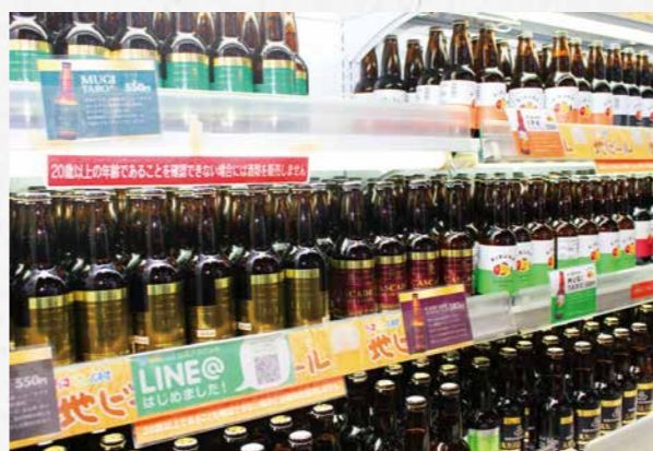
物産館には人気銘柄が勢ぞろい

「立ち上げの翌年である平成9年は、ブームの恩恵もあつて年間販売量が最も多かった時期でした。一方で、当時は醸造技術も手探り状態で、情報も不足していました。全国各地で多くの醸造所ができましたが、品質や味が不安定になりがちという課題もあり、徐々に地ビールブームも落ち着いていきました。消費者に地